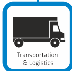
Transportation & Logistics